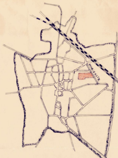
ÜBERSICHTSSKIZZE SCHÖNINGEN M 1:25000