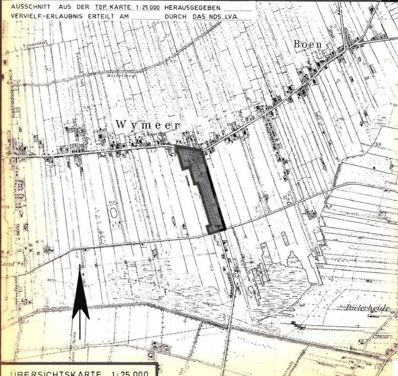
ÜBERSICHTSKARTE 1:25 000

Der Rat der Samtgemeinde Bunde hat in seiner Sitzung am 11.7.1979 die Aufstellung des Bebauungsplans Nr. 05.02. "Im Dorfe II" beschlossen. Der Aufstellungsbeschluß ist gemäß § 2 Abs. 1 BBauG am 21.8.1979 ortsrätlich bekanntgemacht.